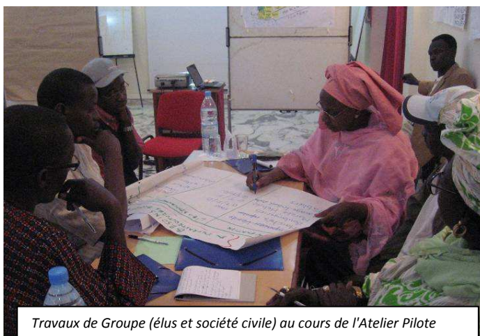
Travaux de Groupe (élus et société civile) au cours de l'Atelier Pilote