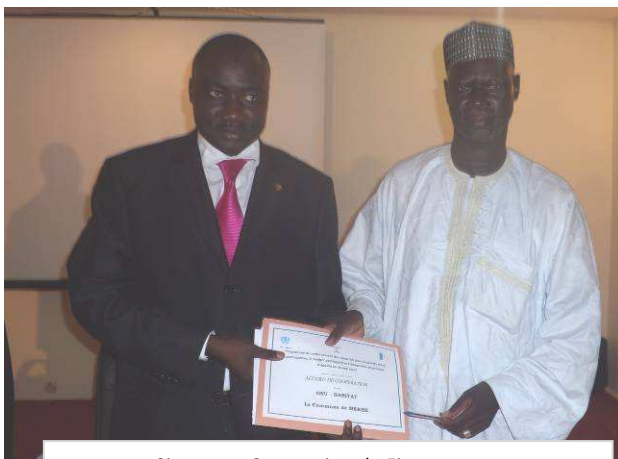
Signature Convention de Financement (Projet Budget Participatif Sénégal) Ici HMP Onu HABITAT et Maire Commune de Méckhé