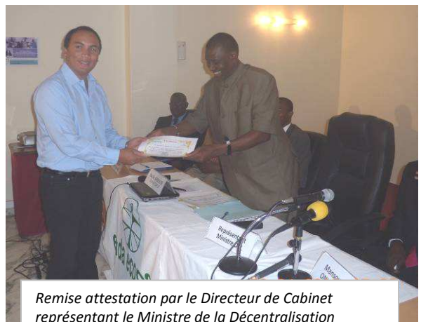
Remise attestation par le Directeur de Cabinet représentant le Ministre de la Décentralisation et des Collectivités Locales